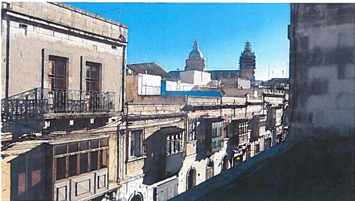
Ritratti ta' Triq Bormla.