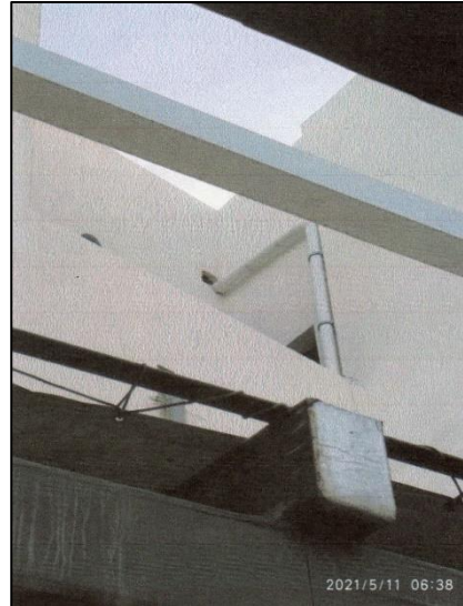
Anness ma' Dok ES, a fol 50 tal-proċess

28. Fir-Rapport tagħha, il-Perit Tekniku Elena Borg Costanzi ddikjarat: