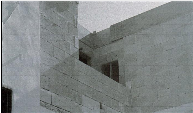
Anness mar-rikors promotur, a fol 12 tal-proċess

27. L-iżvilupp illi sar skont il-pjanti riveduti jirriżulta mir-ritratti esebiti mir-rikorrenti stess kif isegwi: