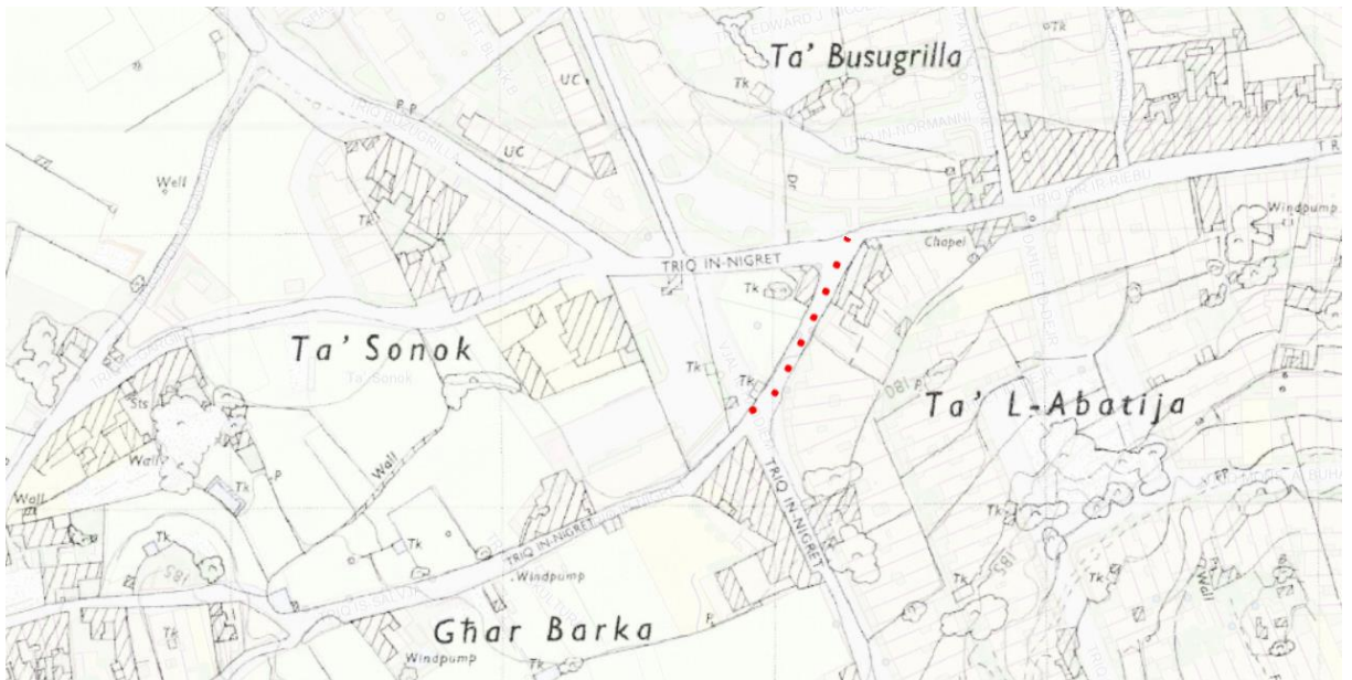
Fig. 2 – Site Plan mill-mapserver tal-Awtorità tal-Ippjanar – Sena 1968.