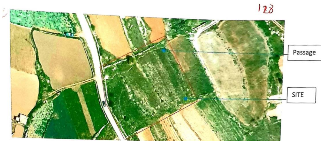
2016 Aerial Photograph

(d) L-aerial photo tal-2016 li tinsab fir-rapport tal-perit tal-atturi: