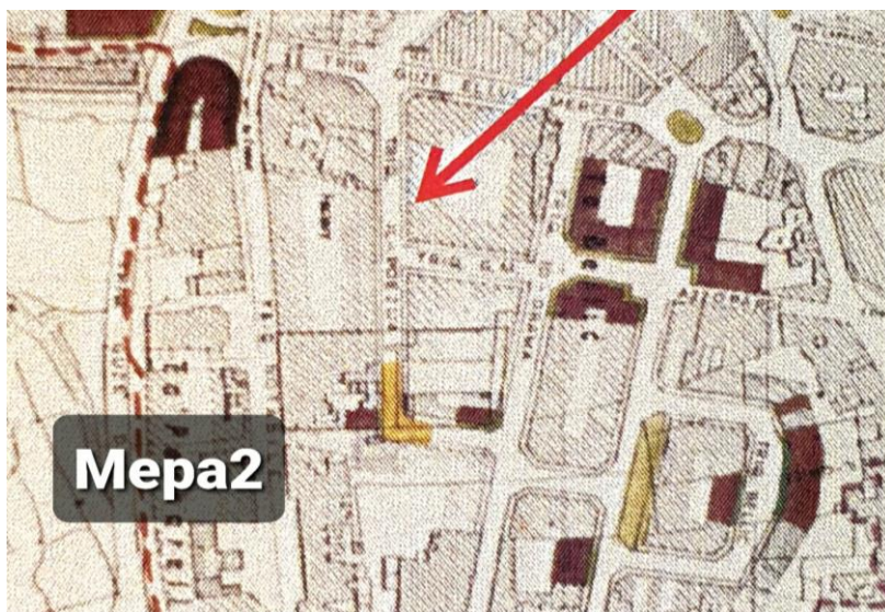
(dettall minn Dok MEPA2)

1989 Oliver Magro 4 (MEPA) xehed skont il-pjanta ta' l-iskema tal-1989 (Dok MEPA2), il-kantuniera ndikata bl-isfar - ċjoè fejn jiltaqgħu Triq Lydda u Triq il-Poeżija - kienet skemata biex tinfetaħ bħala triq . Spjega li biċċa minn Triq il-Poeżija però baqgħet ma nfetħitx. (Triq il-Poeżija hija ndikata bi vleggja ħamra).