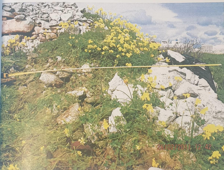
Figure 2: Rubble wall between two fields at the same level within Camcas Ltd. property having an average width of 1.70m.