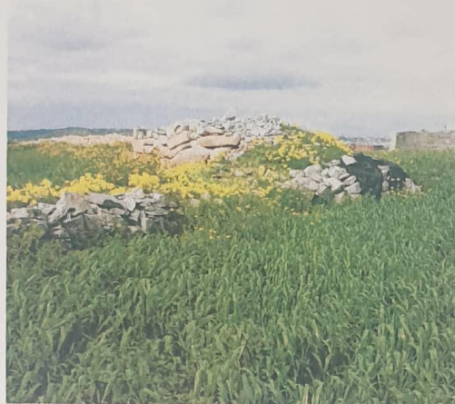
Figure 1: Rubble wall between two fields at the same level within Camcas Ltd. Property

same thickness and are dividing land which is on the same level ", (kif indikati fuq ir-ritratti Figure 1 u Figure 2 ). F'dan id-dawl allura ma jistax wieħed jikkonkludi, abbażi biss tal-ħxuna tal-ħajt tas-sejjeħ in kwistjoni, li l-istess kien qed jaqdi funzjoni ta' retaining wall bejn għelieqi f'żewġ livelli.