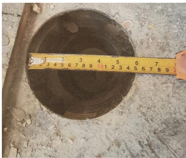
Photo showing hole with measurement